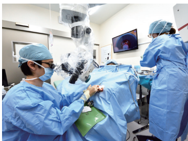
患者に聞こえを確認しながら施行

局所麻酔下のため、患者に聞こえを確認しながら手術を進められるのも大きなメリット。さまざまなアプローチを試みな